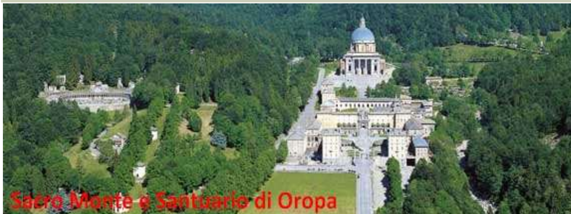
Sacro Monte e Santuario di Oropa