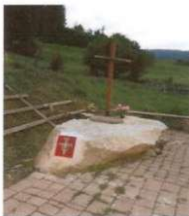
Altare in pietra a Rumo "Casa Sogno"

Dal 7 al 9 giugno 2018 P.ZZA PERTINI - COLLEGNO